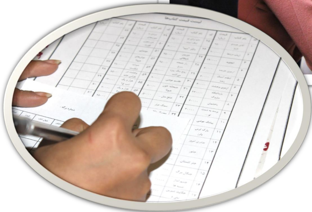
برگزاری نمایشگاه کتاب